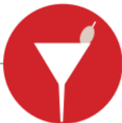
CONSUMO DE ÁLCOOL EM EXCESSO