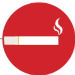
CONSUMO DE TABACO