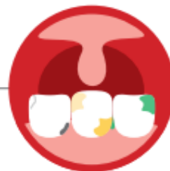
HIGIENE ORAL DEFICITÁRIA