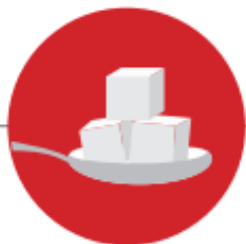
DIETA RICA EM AÇUCARES

As doenças orais partilham muitos dos fatores de risco de outras doenças. Alguns como a idade, sexo, hereditariedade são fatores de risco conhecidos como não modificáveis. Os fatores de risco relacionados com os hábitos, comportamentos e estilos de vida, são considerados modificáveis e incluem: