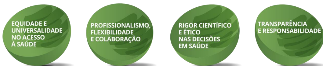
Figura 1: Valores da DGS

A DGS desenvolve a sua missão de acordo com o seguinte conjunto de valores .