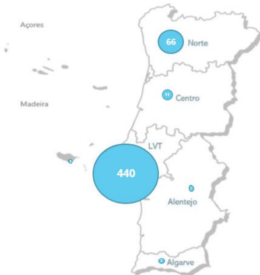
Figura 2. Distribuição por regiões de saúde dos casos reportados no SINAVEmed de Infecção humana por vírus Monkeypox (N=536) a 27 de julho de 2022 - Portugal, 2022