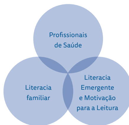
Figura 2. Os profissionais de saúde e a promoção da literacia familiar e emergente

Nesta brochura, procurou-se sistematizar informação sobre a forma como as crianças desenvolvem competências de literacia emergente, o efeito da literacia familiar neste desenvolvimento e de que forma os profissionais de saúde podem promover a literacia familiar e das crianças.