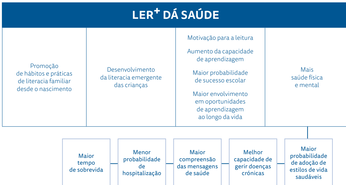
Figura 1. Fundamentação do Programa Ler+ dá Saúde