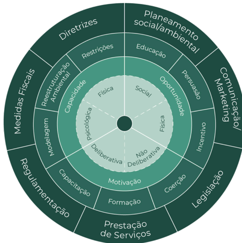
Figura 3. Roda de Mudança Comportamental

Adaptado de: The behaviour change wheel: a new method for characterising and designing behaviour change interventions (Michie et al., 2011)