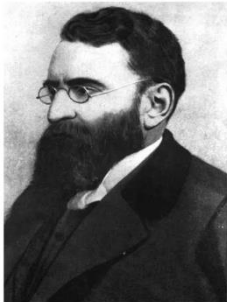
Ricardo Jorge (1911-1928)

Médico e Professor de Clínica Médica na Escola Médico-Cirúrgica de Lisboa (1861), foi o primeiro Diretor-Geral de Saúde e de Beneficência Pública.