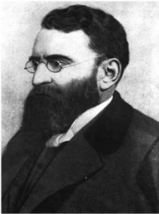
Ricardo Jorge (1911-1928)

Médico e Professor de Clínica Médica na Escola Médico-Cirúrgica de Lisboa (1861), foi o primeiro Diretor-Geral de Saúde e de Beneficência Pública.