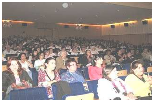
Plateia do Seminário