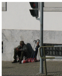
Pessoas em situação de Sem Abrigo da cidade de Beja