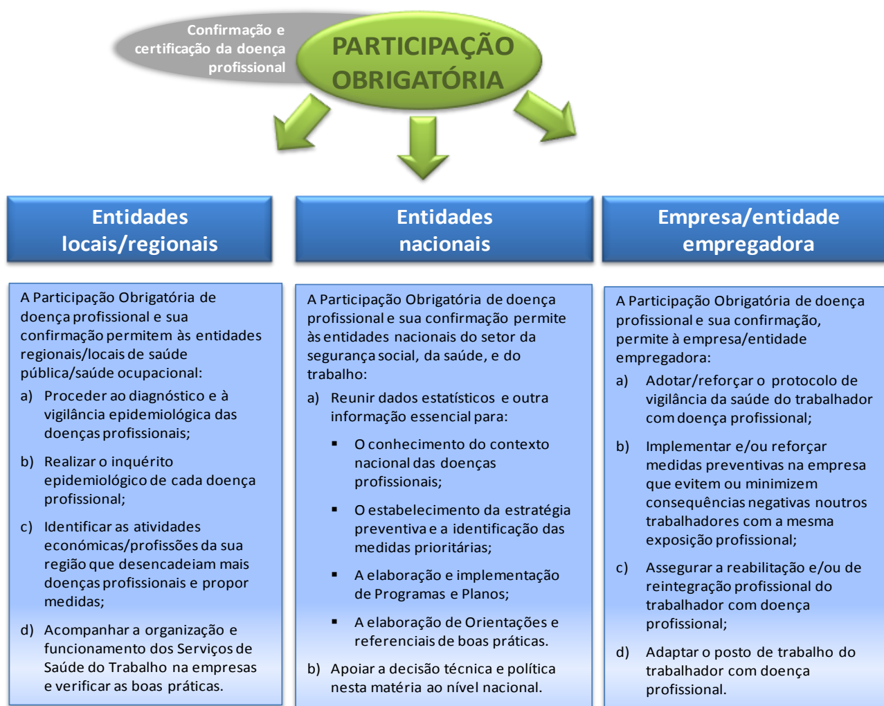
Figura 1 – Vantagens da Participação Obrigatória de doença profissional

A Participação Obrigatória, ao desencadear o processo de certificação de doença profissional, para além de constituir uma ferramenta de considerável importância na vigilância epidemiológica da morbilidade profissional, assegura a reparação ao trabalhador e seus familiares, facilita a recolha de informação/dados de grande utilidade e relevância para a empresa/entidade empregadora e para os Serviços de Saúde Ocupacional, de âmbito nacional, regional e local, fundamentais para a conceção ou melhoria de uma eficaz estratégia preventiva ( vide Figura 1).